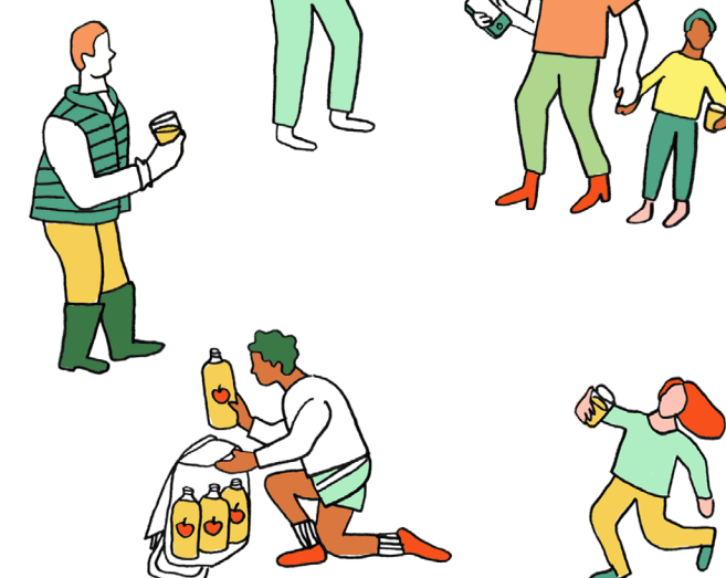
illustration : Fanny Monier